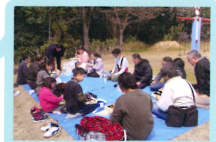
屋外での交流行事

利用者に合わせて さまざまな活動をサポート。 じぶんにあった活動に 自由に、ご参加いただけます。